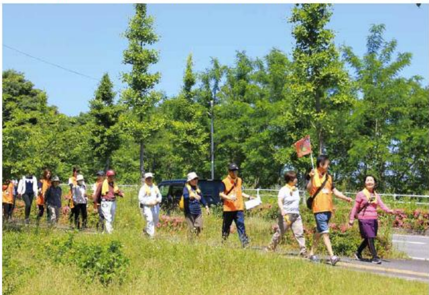
第13回 楽・楽けんこうウォーキング